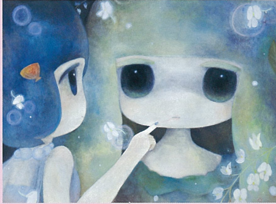
ob 彼女の唇に紅をさし、失敗して笑った。 2013年 個人蔵 ©2013 ob / Kaikai KikiCo., Ltd. All Rights Reserved.