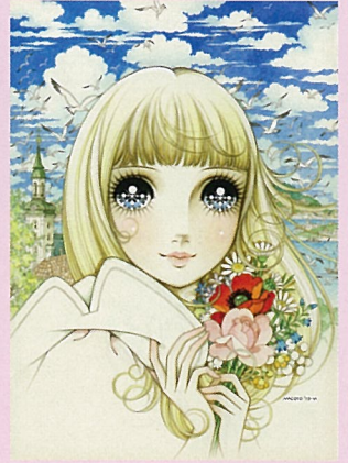
高橋真琴「テラックスマーガレット」 1973年夏の号表紙原画 作家蔵 ©高橋真琴