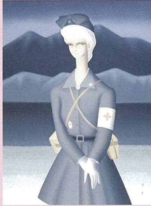
東郷青児 ナース像 1974年 日本赤十字社蔵