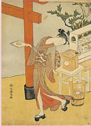
鈴木春信 団子を持つ豆蔵おせん 1768~69年頃 個人蔵 (1月19日まで展示)