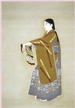
山川秀峰 序の舞 1932年 東京国立近代美術館蔵 (1月21日から展示)

2月1日(日)~2月16日(月)、ミュージアムパスポート会員を対象に素敵なプレゼントが当たる特別抽選会を行います。