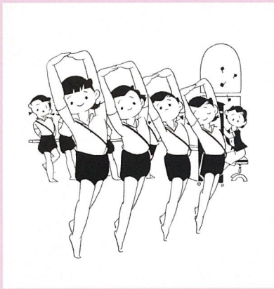
松本かつぢ「少女の友」カット 1920~30年代 弥生美術館蔵