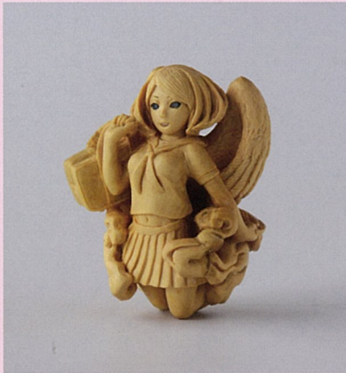
永島信也 女校校生 2014年 個人蔵

「美少女」は、アニメやマンガ、文学、芸能など私たちが日ごろ親しんでいる様々な文化に登場します。現代日本のポップカルチャーの特徴のように思われがちですが、果たしてそうでしょうか？ この展示会では、江戸時代から現代までの様々な造形から「少女」がいかに表現されてきたかを紹介し、人々は「少女」に何を求めてきたのか？「美少女」とは何か？その答えを探しに、時代やジャンルの垣根を越えた多彩な作品による少女の迷宮を巡ってみませんか。