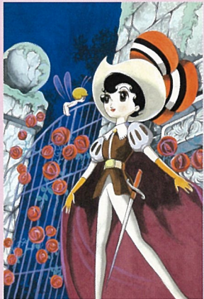
手塚治虫 リボンの騎士「なかよし」1964年 6月号ふるく表紙絵) ©手塚プロダクション